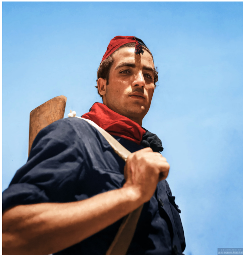
Un miliziano de la CNT appartenente alla etnia gitana. 1936.

Fotografia original de Antoni Campaña, colorada por Julius.